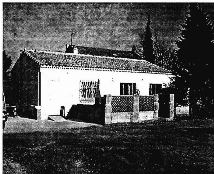
bâtiment nouvelle salle de restauration